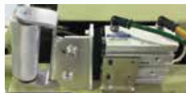
▲エア一式押しローラー