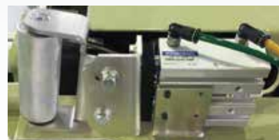
▲エア式押えローラー