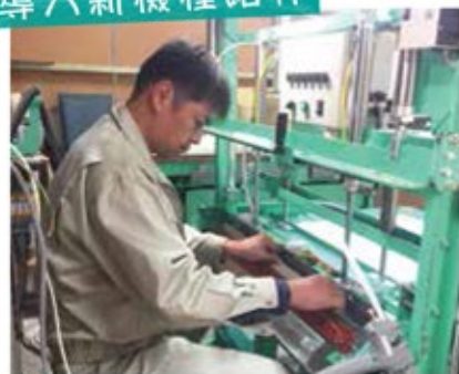
縁無し畳製作支援機