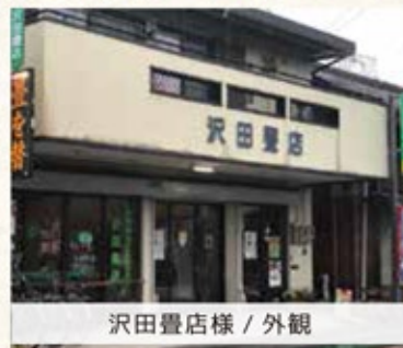
沢田畳店様 / 外観

創業大正2年100年以上の歴史をもつ沢田畳店様は、埼玉県畳高等職業訓練校出身の沢田実付晴社長(45歳)を筆頭に家族4人で地域に根付いた営業をされております。