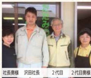
社長奥様 沢田社長 2代目 2代目奥様