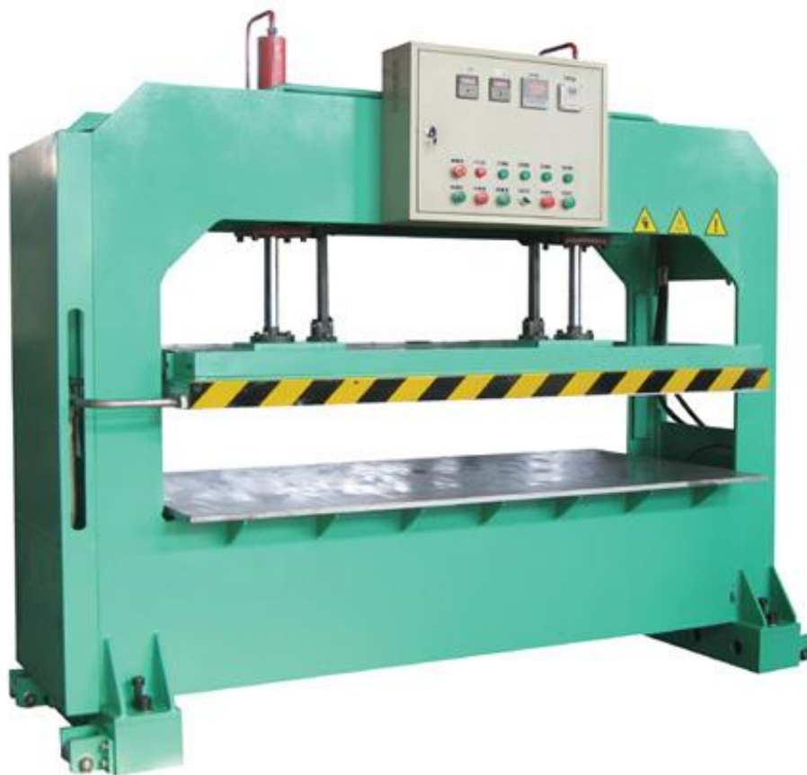
■ヒートプレス 仕様

畳表を床全体に綺麗に接着出来ます。 畳表に不織布等で裏打ちが出来ます。 縁無し薄畳の裏面の凸凹を平滑に出来ます。 置き畳の裏面全体に滑り止めを接着出来ます。 複数の床素材の多層構造接着が出来ます。 打ち込みの少ない表の目を詰める事が出来ます。